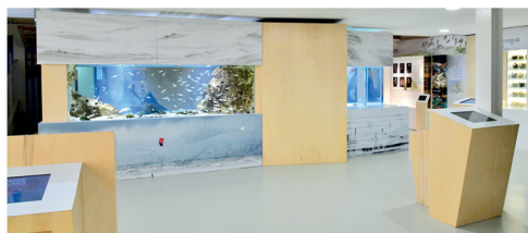
L'aquarium de la Maison du Site