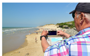
PHOTOSPOT N°6 - BAIE DE WISSANT Digue Nord de Wissant avant la descente à la mer