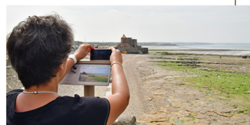
PHOTOSPOT N°2 DIGUE D'AMBLETEUSE Au milieu de la digue sur le Belvédère