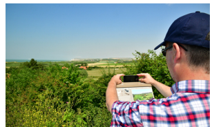
PHOTOSPOT N°5 - EGLISE DE TARDINGHEN Au pied de l'Eglise à droite du Belvédère