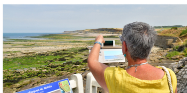
PHOTOSPOT N°3 - AUDRESSELLES Sur le Sentier des Pêcheurs panneau n°9 «les Phoques du Noirda»