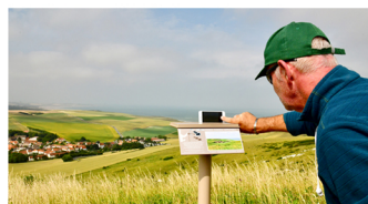
PHOTOSPOT N°7 - MONT D'HUBERT en haut du Mont d'Hubert à droite du Belvédère