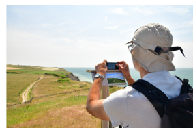
PHOTOSPOT N°4 CAP GRIS-NEZ Sortie du parking sur votre gauche en haut du Belvédère de la Nature